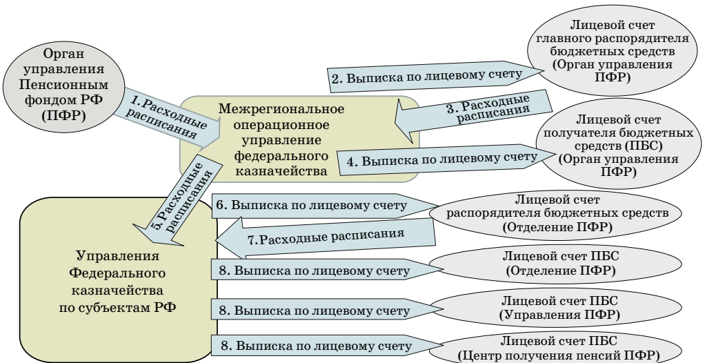
Рис. 2. Доведение бюджетных данных участникам бюджетного процесса Пенсионного фонда РФ через органы Федерального казначейства

Схематично процесс доведения бюджетных данных участникам бюджетного процесса Пенсионного фонда РФ через органы Федерального казначейства представлен на рис. 2. Следует отметить, что переход на кассовое обслуживание исполнения бюджета Пенсионного фонда России позволит существенно оптимизировать расходы фонда на его содержание [3, с. 48].